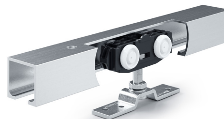
Rollan 80 NT